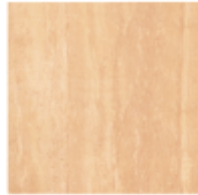
Corumba Beige M-20 PEI IV - NCHS 5