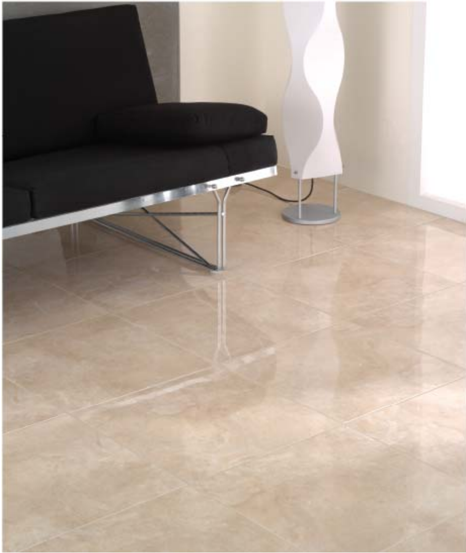
GRESITEC 2007 PAVIMENTO GRES Série FUSTE 45 x 45 cm