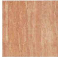
Corumba Marrón M-20 PEI IV - NCHS 5